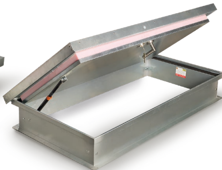
FDA-Oberdeckel mit Gasdruckfeder